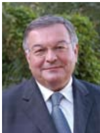
Michel MERCIER Ministre de l'Espace rural et de l'aménagement du territoire